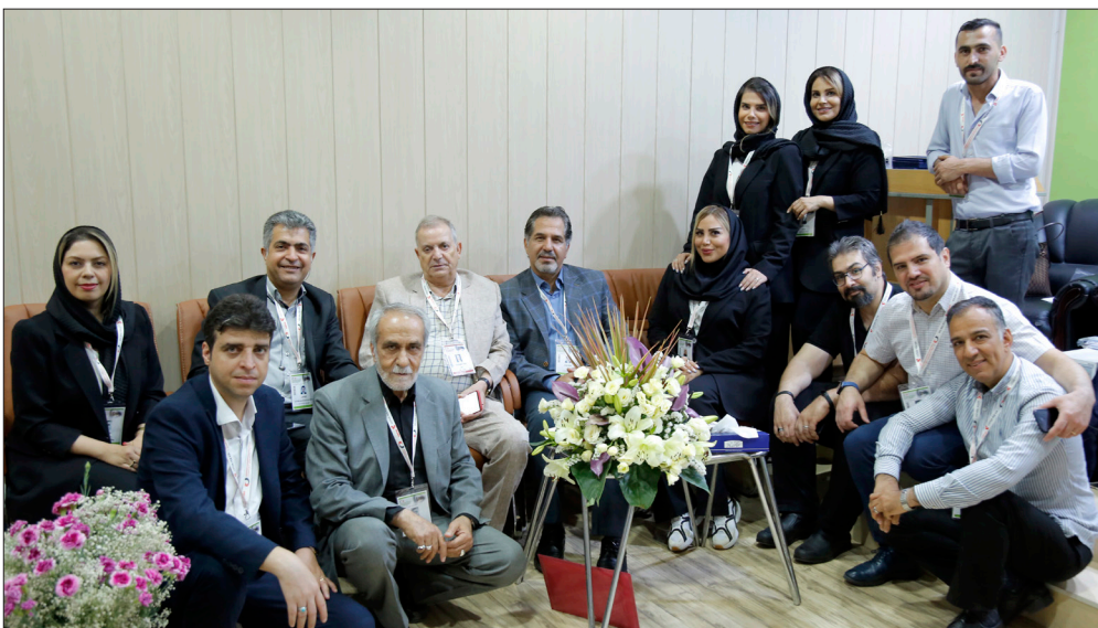
همکاران دبیر خانه کمیته اجرایی کنگره‌های چشم پزشکی

ببینید دستورالعمل ثبت نام برای آموزش مداوم این است که ۴۰۰ هزار تومان از همکاران گرفته و به حسابی ریخته شود که ثبت اقتصادی و کد اقتصادی داشته باشد و یا وابسته به یک موسسه اقتصادی باشد؛ این موضوع دست‌وپای ما را بست و اگر نه ما می‌توانستیم از قبل ثبت نام داشته باشیم و شاهد این تراکم به‌ویژه در روز اول نباشیم. نکته